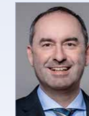
von Hubert Aiwanger

Stellvertretender Ministerpräsident des Freistaates Bayern und Bayerischer Staatsminister für Wirtschaft, Landesentwicklung und Energie